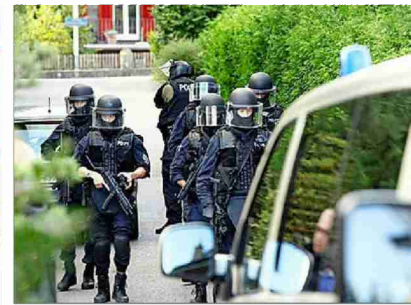
Die Suche nach Kneubühl dauerte tagelang. Spezialeinheiten aus der ganzen Schweiz waren im Einsatz.