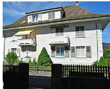
Das Elternhaus von Kneubühl in Biel im Kanton Bern hätte versteigert werden sollen.